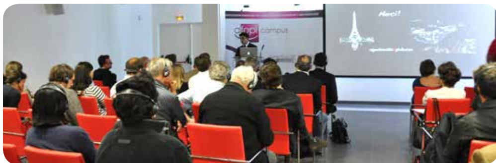
Salle de conférence d'Afopi Campus