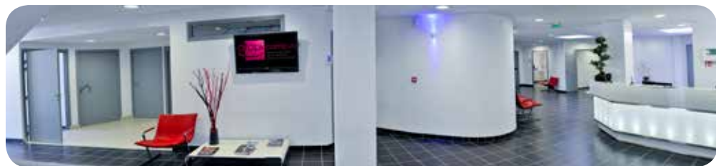
Accueil d'Afopi Campus